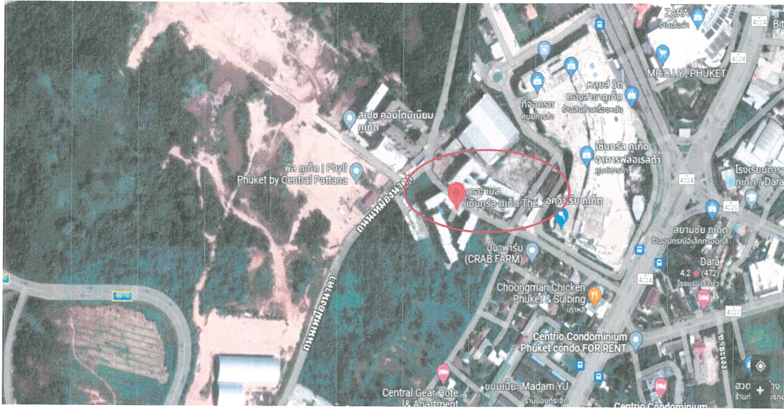
รูปภาพที่ 1.1 แผนที่ตั้งของโครงการ เดอะ เบส เซ็นทรัล ภูเก็ต (Top view)

ระยะดำเนินการ ระหว่างเดือน มกราคม - มิถุนายน 2566